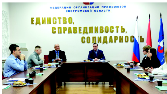
Молодежь и профсоюз – это плюс