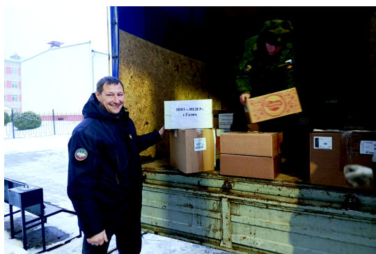
Костромские профсоюзы – фронту