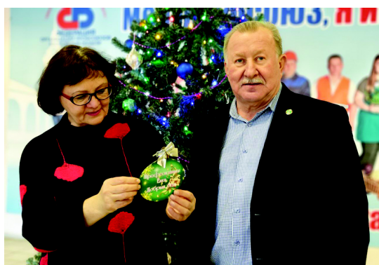
Профсоюзная Елка Добрых Дел