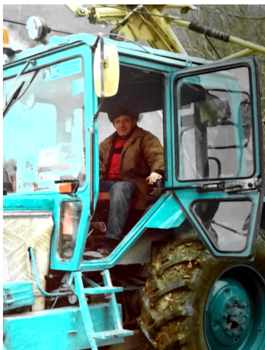
Ко Дню энергетика