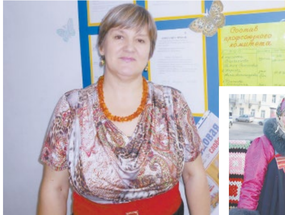
ЖИЗНЕННЫЙ ОПЫТ НАУЧИЛ МЕНЯ ЛЮБИТЬ ДЕТЕЙ, ПОНИМАТЬ ЖИВОТНЫХ И ОБЩАТЬСЯ С САМЫМИ РАЗНЫМИ ЛЮДЬМИ.

— Цирку присуще «особое дыхание». Притягивает сама атмосфера цирка, его стены. Но самое главное для меня